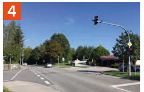
Kreuzungsbereich St 2573 / Von-Aychsteter-Straße