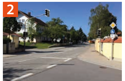
Querungshilfe Wolfratshausener Straße an der Kirche