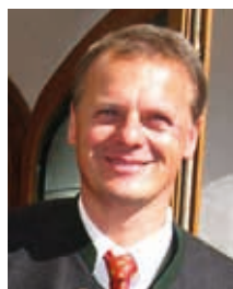
Vertreter der Gemeinde bei der Verkehrswacht München Klaus Zimmermann 2. Bürgermeister