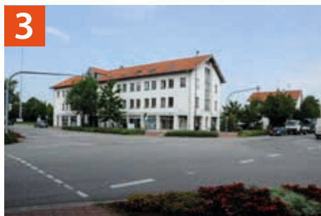
Kreuzungsbereich Münchener Straße / Wolfratshausener Straße